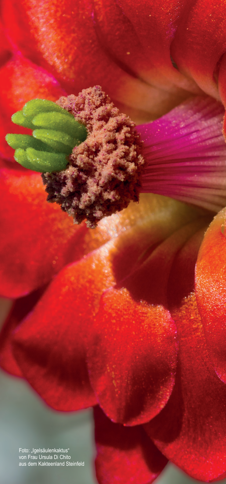
Foto: „Igelsäulenkaktus“ von Frau Ursula Di Chito aus dem Kakteenland Steinfeld